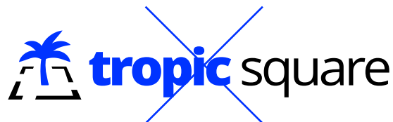
Špatné použití barev